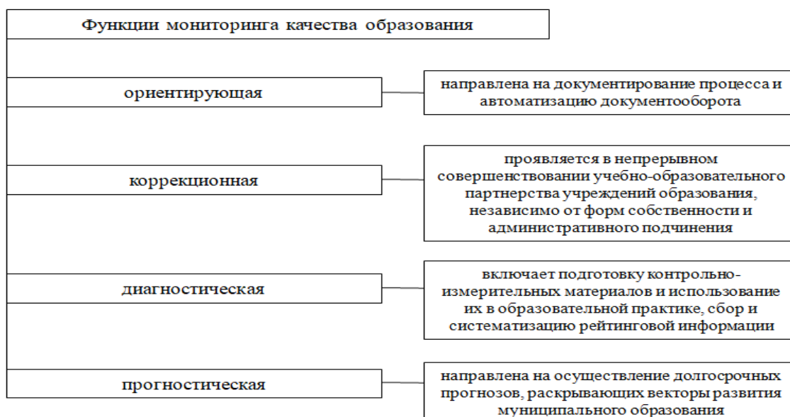
Рисунок 2 – Функции мониторинга качества образования [8, с.46]

Если рисунок взят из первичного источника без авторской переработки, следует сделать ссылку, например: